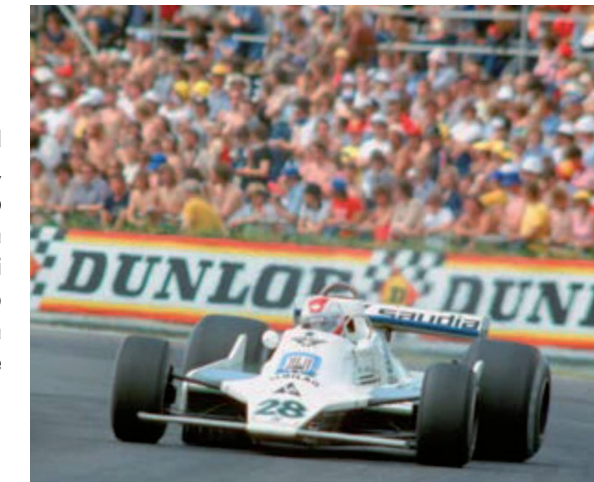
1979, GP di Inghilterra, prima vittoria della Williams con il nostro Clay Regazzoni alla guida. Dietro, la pubblicità della Dunlop.

Il veterinario scozzese John Boyd Dunlop, che esercitava in Irlanda, diventò celebre per aver inventato nel 1887 la prima ruota pneumatica gonfiando d'aria un tubo di fogli di gomma per le ruote del triciclo di suo figlio. La ditta Dunlop esiste tuttora ed è sempre attiva nella produzione di pneumatici.