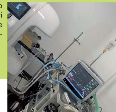
Indagine TAC cane, tiVET veterinari

Da qualche decennio ormai non esiste più il veterinario tuttofare, quello che si occupa di tutta una serie di interventi su tutta una serie di animali. Oggigiorno siamo anche noi diventati degli specialisti. Non solo per quanto concerne il tipo di animali dei quali ci occupiamo, ma anche delle diverse patologie, delle diverse diagnostiche e delle diverse terapie. Quale sarà il futuro del nostro mestiere di veterinario? Il veterinario generalista che lavora nel suo studio con una o due infermiere andrà scomparendo. Sempre di più appariranno centri con diversi veterinari specialisti con infrastrutture e servizi molto simili agli ospedali della medicina umana.