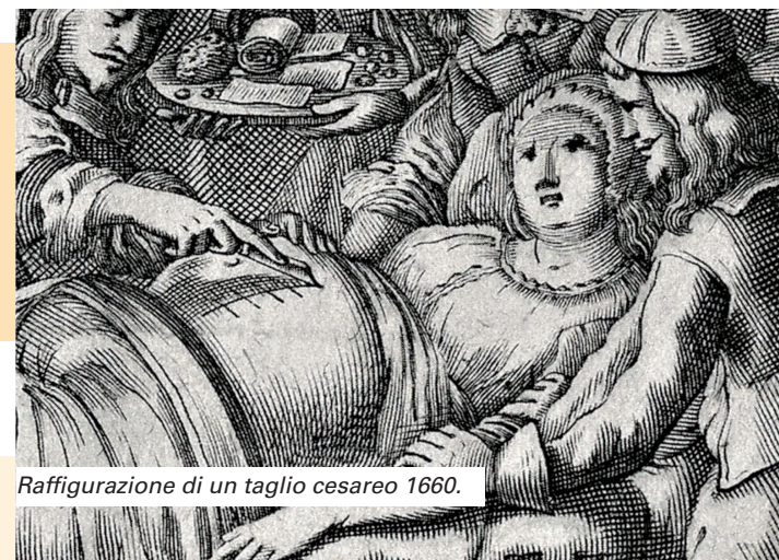
Raffigurazione di un taglio cesareo 1660.