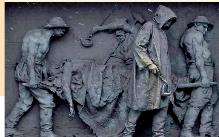
Monumento di Vincenzo Vela dedicato ai caduti durante la costruzione del tunnel ferroviario del San Gottardo, terminato nel 1882. Tra questi caduti figurano anche le vittime dell'anemia dei minatori.